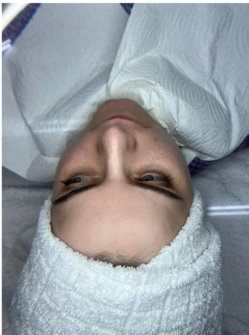
4 η Συνεδρία- Πριν την εφαρμογή

Το peeling έφερε τα αντίθετα αποτελέσματα από αυτά που περιμέναμε. Αύξησε τα επίπεδα της λιπαρότητας και το πρόσωπο φαινόταν όσο λιπαρό ήταν και πριν την έναρξη της θεραπείας. Η μάσκα αζουλενίου αντιθέτως είναι ένα προϊόν κατάλληλο και πολύ βοηθητικό στη μείωση της λιπαρότητας με αποτέλεσμα η κατάσταση να ισορροπήσει.